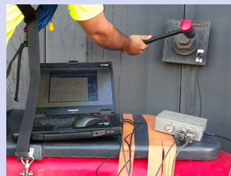
Figure n°1 : Mise en œuvre des essais et matériel

Le tirant est mis en vibration grâce à un impact dont la force F est connue. La réponse vibratoire V du tirant sous cet impact est enregistrée. L'analyse porte sur le rapport V/F , dans le domaine fréquentiel, afin de déterminer la longueur et la tension dans le tirant®.