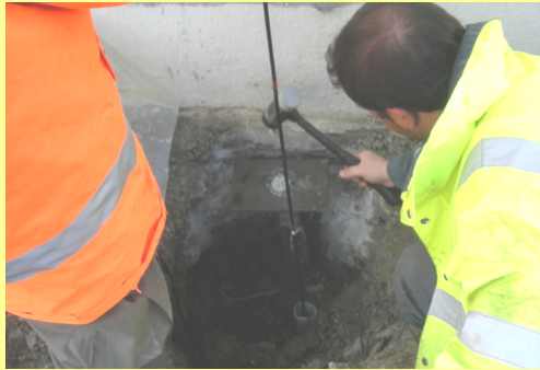
Figure n°1 : Réalisation de l'essai - Exemple